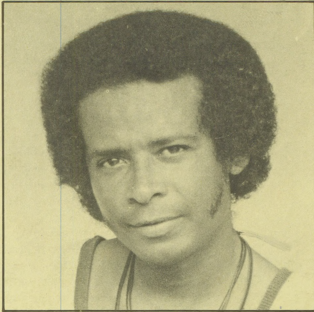
Direktor: Pacheco Domacassé